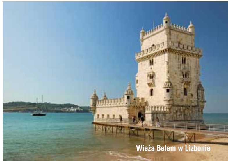
Wieża Belem w Lizbonie