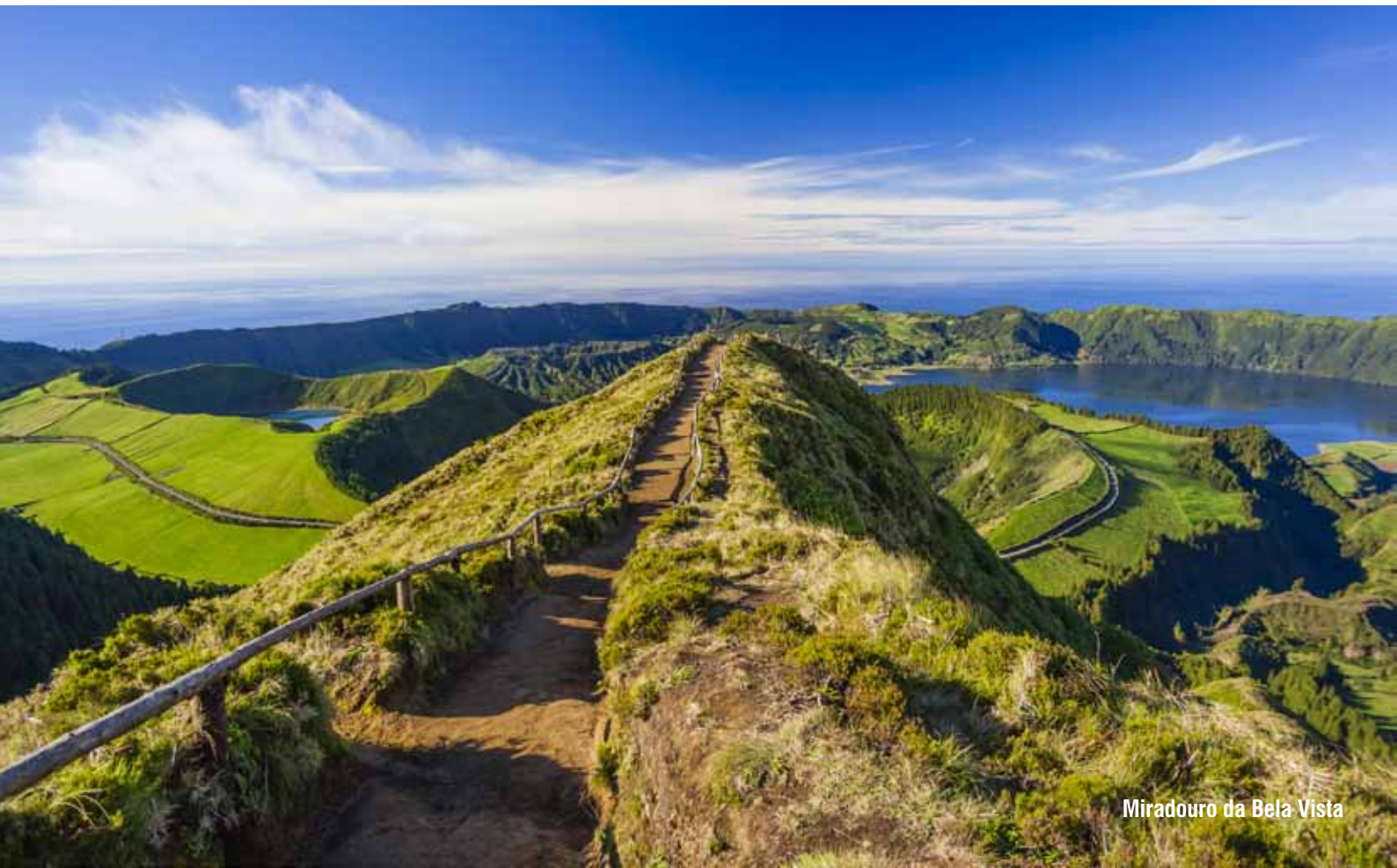
Miradouro da Bela Vista

Dodatkowo płatne: posiłki, napoje oraz świadczenia niewymienione w ofercie; ewentualne dodatkowe bilety wstępu do zwiedzanych obiektów ok. 55 EUR/os. oraz zwyczajowe napiwki 50 EUR/os.; zakwaterowanie w pokoju jednoosobowym 325/600 EUR.