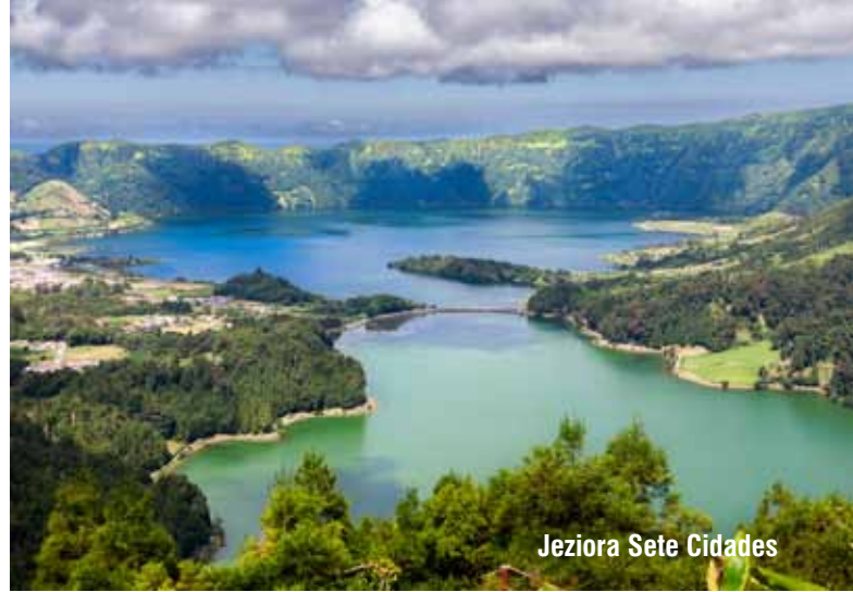
Jeziora Sete Cidades

Rano przejedziemy z Lizbony do uroczej Sintry zwanej miastem-ogrodem, położonej w głębokich, porośniętych lasem wąwozach i otoczonej górami Serra de Sintra. Tutejszy mikroklimat jest specyficzny i pozwala na rozwój egzotycznej, niemal tropikalnej roślinności. Już za czasów mauretańskich miejsce to stanowiło ulubiony teren letniego wypoczynku władców Lizbony, czego dowodem są wzniesione na przestrzeni wieków wspaniałe zamki, pałace i klasztory. Zwiedzimy stanowiący fascynującą mieszankę stylów architektonicznych Paácio Nacional, powstały najprawdopodobniej już w czasach mauretańskich. Po wspólnym lunchu popijanym regionalnymi winami i dalszym zwiedzaniu otoczonej bujną zielenią Sintry przejedziemy do najbardziej na zachód wysuniętego miejsca kontynentalnej Europy – Cabo da Roca, gdzie dziki, skalisty przylądek o wysokości około 150 metrów urywa się nad przepaścią opadającą w burzliwą kipieli Atlantyku. Pełen wrażeń dzień zakończymy wieczornym spacerem i noclegiem w Lizbonie.