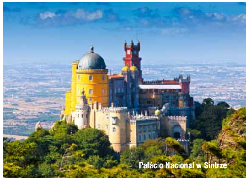
Paácio Nacional w Sintrze