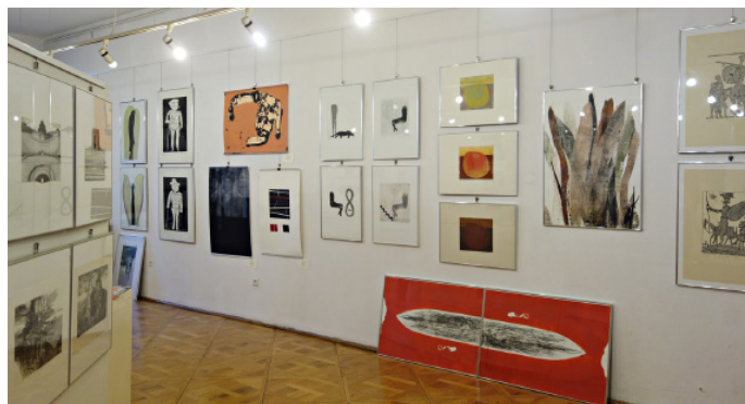
Jan Fejkiel Gallery

Powitanie w Dworze Sieraków i przejazd autokarem do Krakowa. Popołudnie i wieczór spędzimy na krakowskim Podgórzu, dawnej dzielnicy przemysłowej, która po rewitalizacji stała się „najgorętszym” adresem Krakowa. Odwiedzimy położone obok słynnej fabryki Schindlera muzeum Sztuki Współczesnej MOCAR, gdzie zobaczymy intrygującą wystawę „Jedzenie w sztuce”. Po drodze do Cricoteki – muzeum poświęconego twórczości Tadeusza Kantora – przyjrzymy się sztuce ulicy czyli muralom. Współczesna architektura budynku Cricoteki również nie pozostawi nikogo obojętnym. Po zwiedzaniu wystawy z kuratorem, kolacja z winami Izraela na Podgórzu. Powrót do Dworu Sieraków.